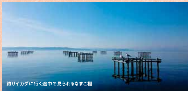
釣リイカダに行く途中で見られるなまこ棚